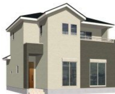
9号棟完成イメージ (現況と異なる場合がございます)